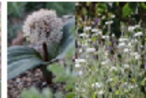
Galium coggrynii - vit