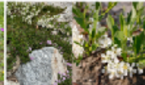
Galium coggrynii - vit