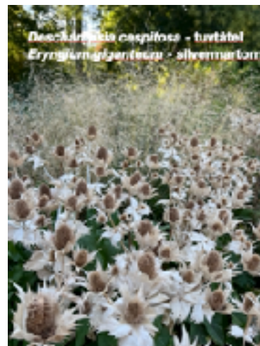
Eryngium yuccifolium - huvudblom Eryngium yuccifolium - silvermarfarn