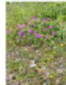
Galium coggrynii - lila