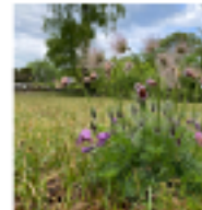
Galium coggrynii - lila