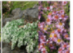
Galium coggrynii - rosa