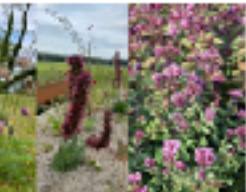
Galium coggrynii - rosa